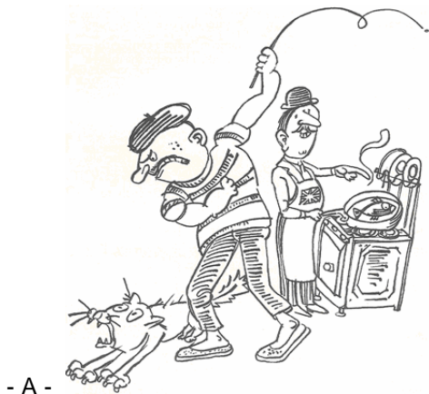
- A -