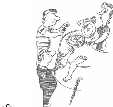
- C -