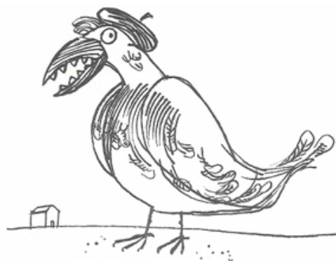
- D -