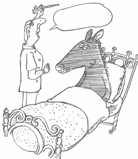
- F -